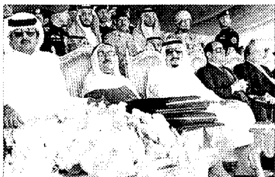
نخست‌وزیر عراق در دیدار با نمایندگان ائتلاف ضد سوری.

شکاف در ائتلاف ضد سوری... این گزارش به بررسی تغییرات در ائتلاف بین‌المللی علیه سوریه می‌پردازد.