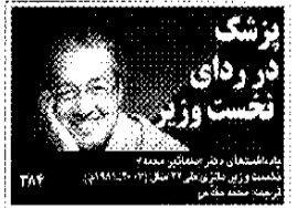
پژشک در ردای نخست وزیر

پژشک در ردای نخست وزیر... در این مقاله به بررسی نقش و جایگاه ایشان در دولت و جامعه می‌پردازیم.